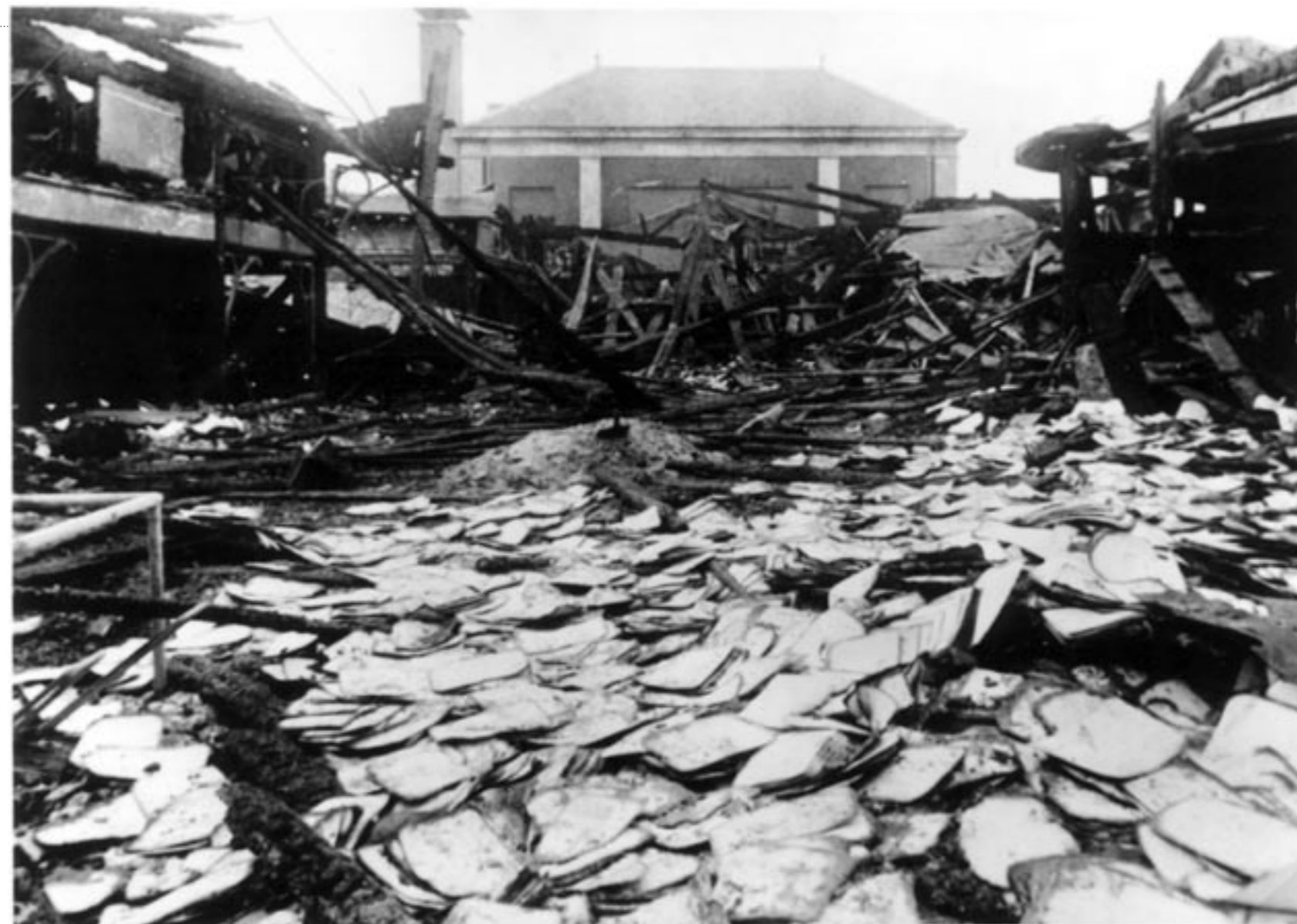
Ravage na de aanslag op het bevolkingsregister in Amsterdam in 1943.

Daarna bleef het lang stil, maar na de aanslagen van 11 september 2001 laaide het debat weer op. Eerst nog alleen over uitbreiding van identificatieplicht bij dreiging van een aanslag, maar al rap was er een meerderheid voor de algehele identificatieplicht.